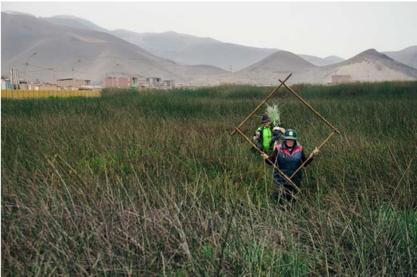
Areli Benito Paredes, egresada del programa anual de fotografía

Desde el 2005, el Centro de la Imagen ofrece el programa anual de fotografía, con el que nuestros alumnos pueden desarrollarse en campos tan variados como el publicitaria, fotografía de fotoperiodismo, la fotografía moda o fotografía artística.