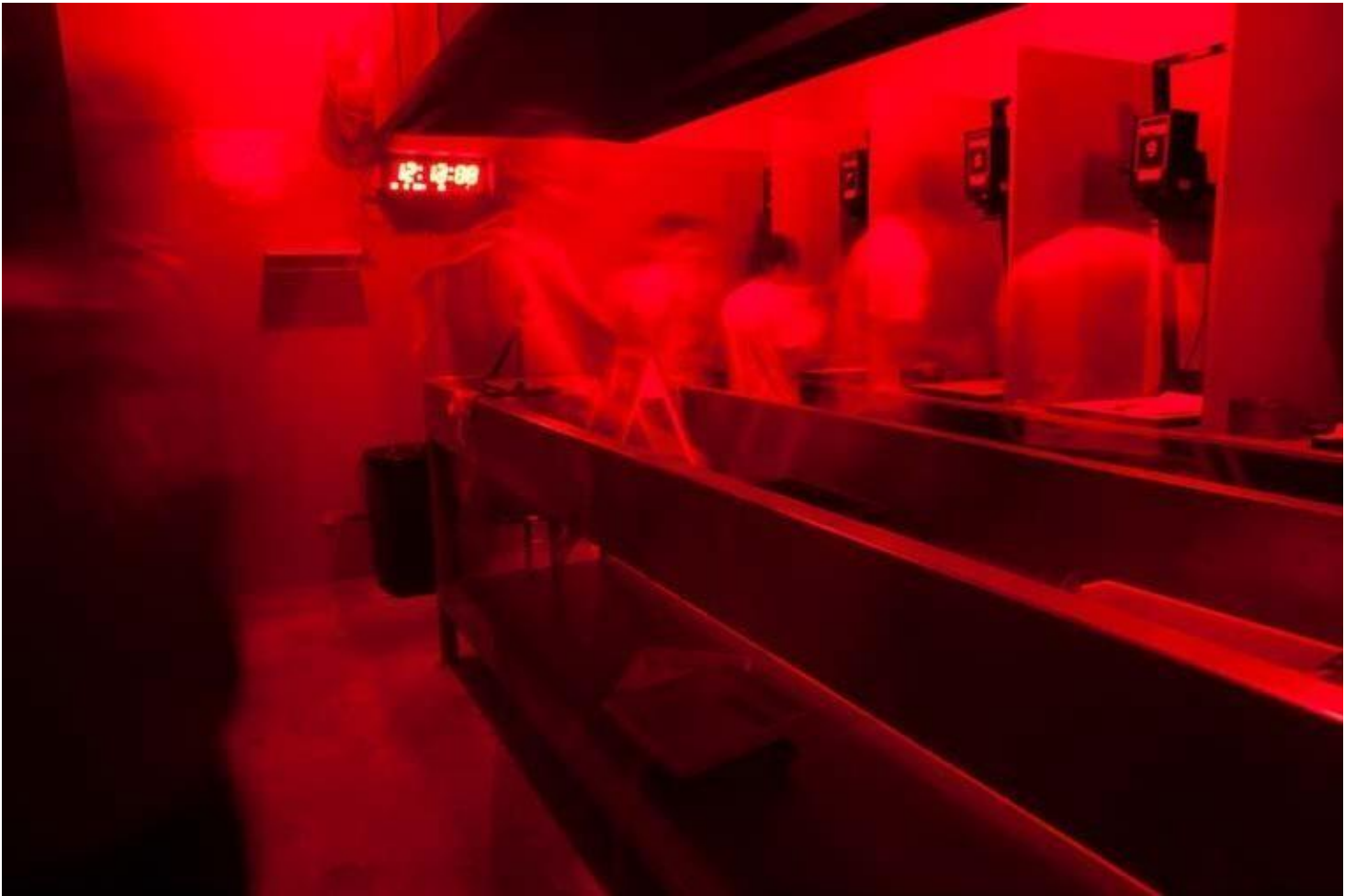
Joao Guerreiro, profesor del programa anual de fotografía

viernes de 7:00 pm a 10:00 pm + sábados de 9am a 12pm